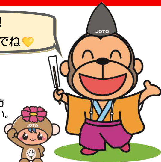
城東区マスコットキャラクター「コスモちゃん」